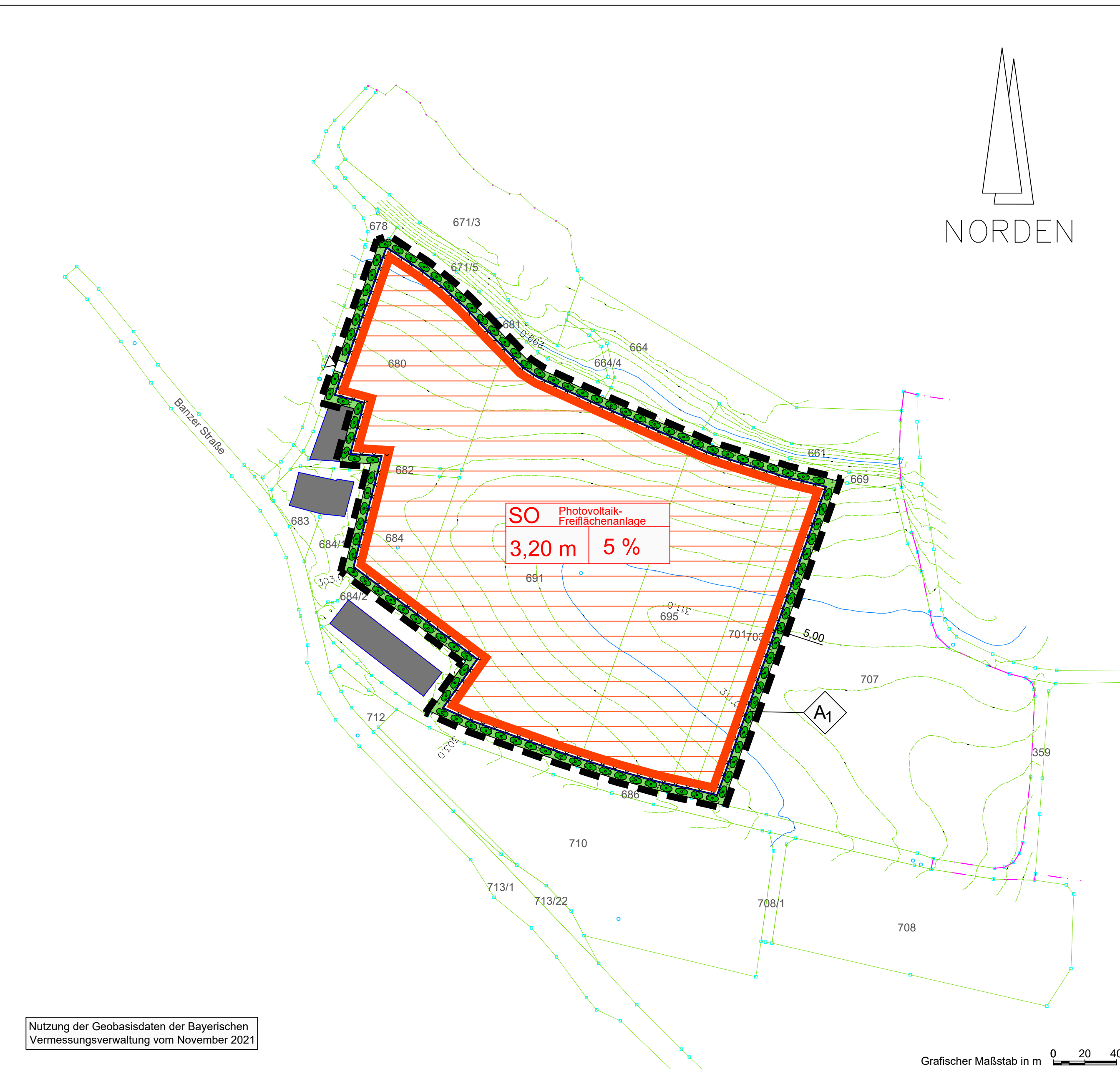
Übersichtslageplan (ohne Maßstab) zum Bebauungsplan "Solarpark Banzer Straße", Gemeinde Untersiemau